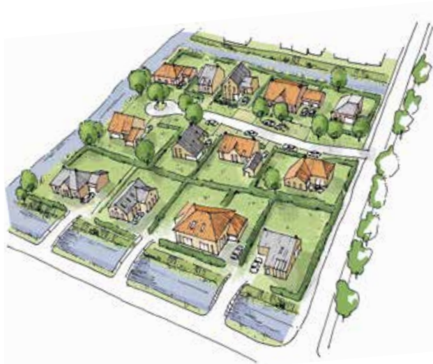
Impressie van de nieuwe wijk Munster. De voorbereidingen zijn gestart.

Winsum hebben aardbevingsschade aan hun huizen. Toch is er voor Winsum geen versterkingsopgave, omdat zij niet in het daarvoor door de NCG aangewezen kerngebied (of contour) ligt. Winsum wil echter wel iets voor haar inwoners doen. De bouw van de nieuwe wijk Munster is daar een mooi voorbeeld van. In deze duurzame, waterrijke en groene wijk komen straks 150 woningen zonder gasaansluiting. Waar andere gemeenten al gasloos bouwen, gaat Winsum met de wijk Munster een stap verder.