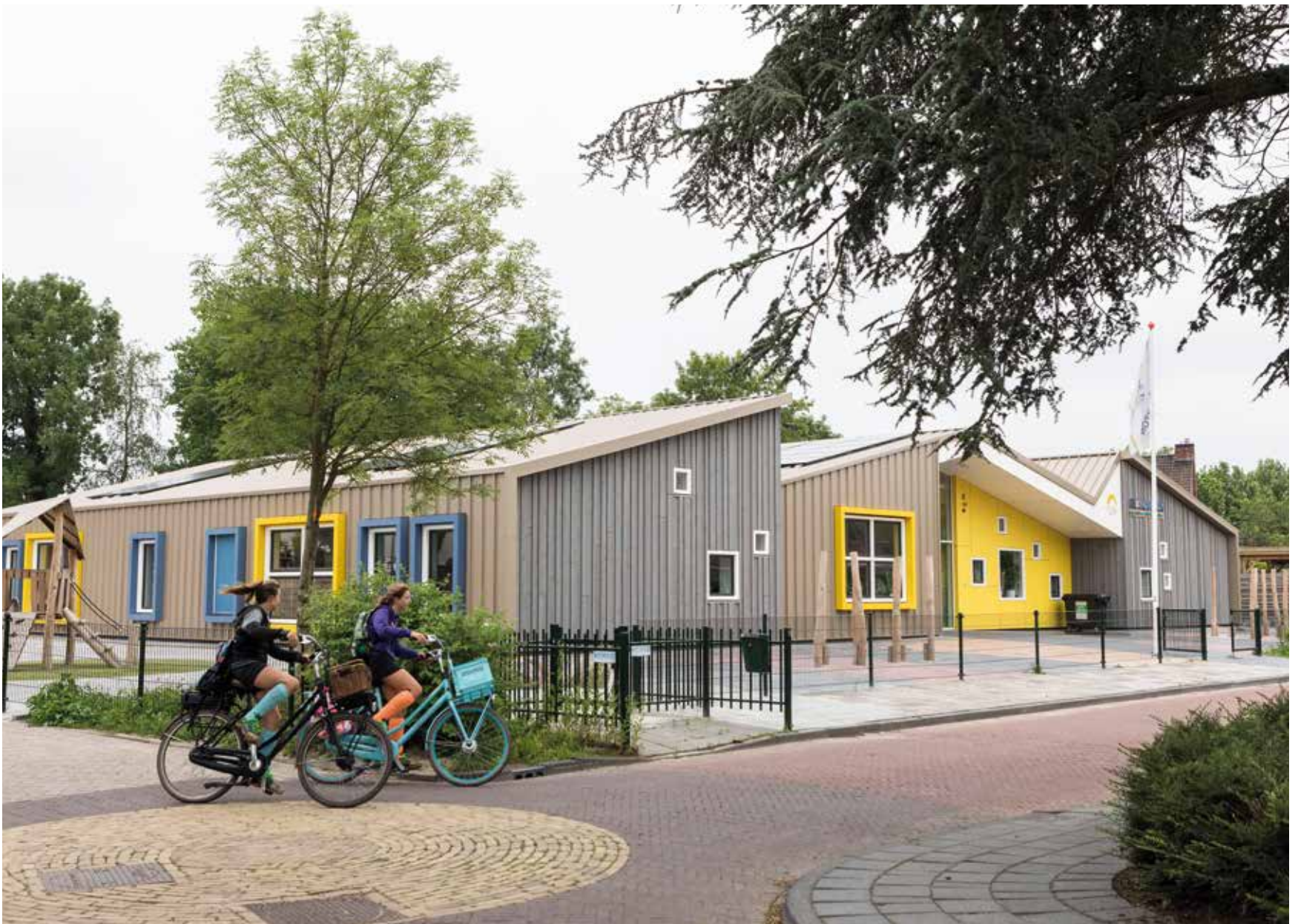
Eerste aardbevingsbestendige school in Bedum De Horizon

"GRONINGERS GAAN NIET BIJ DE PAKKEN NEERZITTEN. DIE STROPEN DE MOUWEN OP EN PAKKEN AAN. 'NAIT SOEZEN MOAR DOUN'."